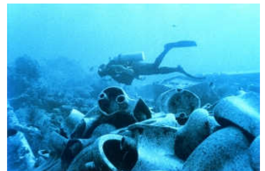
1r Premi de Denúncia ecològica 2003 . Vicente Peiró

El solicitante debe reunir ciertas condiciones para velar por la buena conservación y exposición del material. Se requerirán unos requisitos mínimos, las condiciones de las salas de exposición, la distribución y colocación de las fotografías, la iluminación de la sala y su vigilancia.