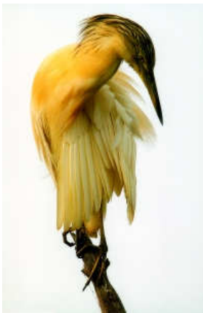
3r Premi de Natura 2005. Kilo Arcas

El formato de las obras es de 40x50 cm en vertical. Todas las fotografías ocupan la parte central del marco y tienen una uniformidad sobre fondo blanco, con los datos de la fotografía al pie derecho de cada obra.