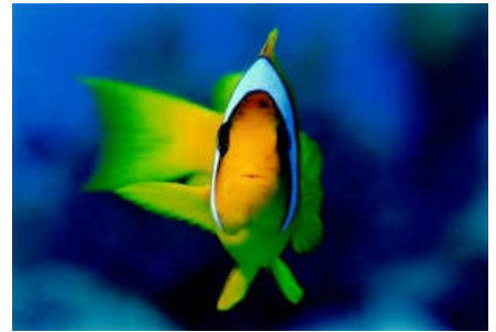
1r Premi de Natura 2001 . Vicente Peiró